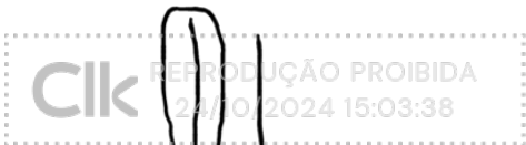
Marconi Matareli Câmpara blob

Assinatura manuscrita com hash SHA256 prefixo aa0d99(...)